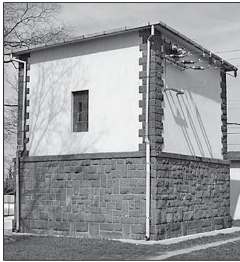
Elektromos elosztó – Donát utca Zsolnai utca sarok

A várostól északkeletre található, a Bicskére tartó főközlekedési út mellett. A középkorban a Csákok birtoka, a csákokói váruadalom része.