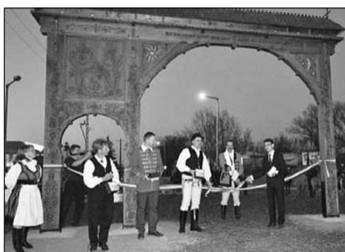
2012 márciusában avatták fel a Székelykaput Maroshegy határában

egészeért. Ez azt is jelenti, hogy én „nem üthetem az asztalt” Maroshegyért akkor, amikor az Öreghegy csatornázását kell megoldani, a csatornázást követően pedig az öreghegyi utcákat fel kell újítani. Felnőtt, felelősséggel bíró képviselőként az egész városért gondolkoznunk kell.