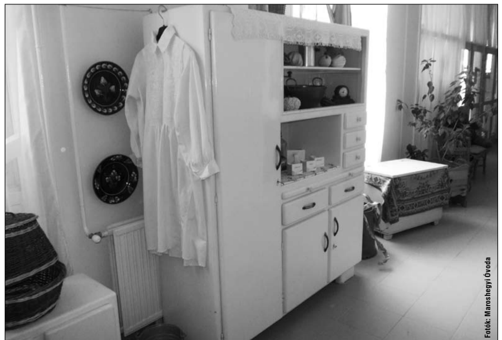
Fotók: Maroshegyi Óvoda

– A művészeti nevelés például abban nyilvánul meg, hogy amikor érkeznek reggel és távoznak délután a gyerekek a szülőkkel, klasszikus zene szól a folyosókon. Hetente többször tornázunk a gyerekekkel komolyzenére selymekkel, szalagokkal. Nem kell, hogy a kisgyerekek megtanulja, melyik zene szól, ki szerezte. Elég, ha csak hallja. Vagy például olyan verseket is elmondanak napközben az óvó nénik, amelyeket nem kell megtanulniuk, csak hallgatniuk. Elmondják, hogy ezt