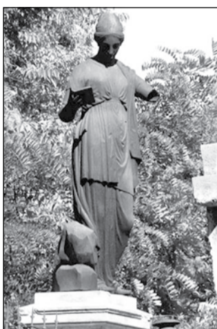
Schlamadinger-Lakos család sírboltja