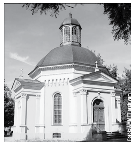
Tosch család mauzóleuma