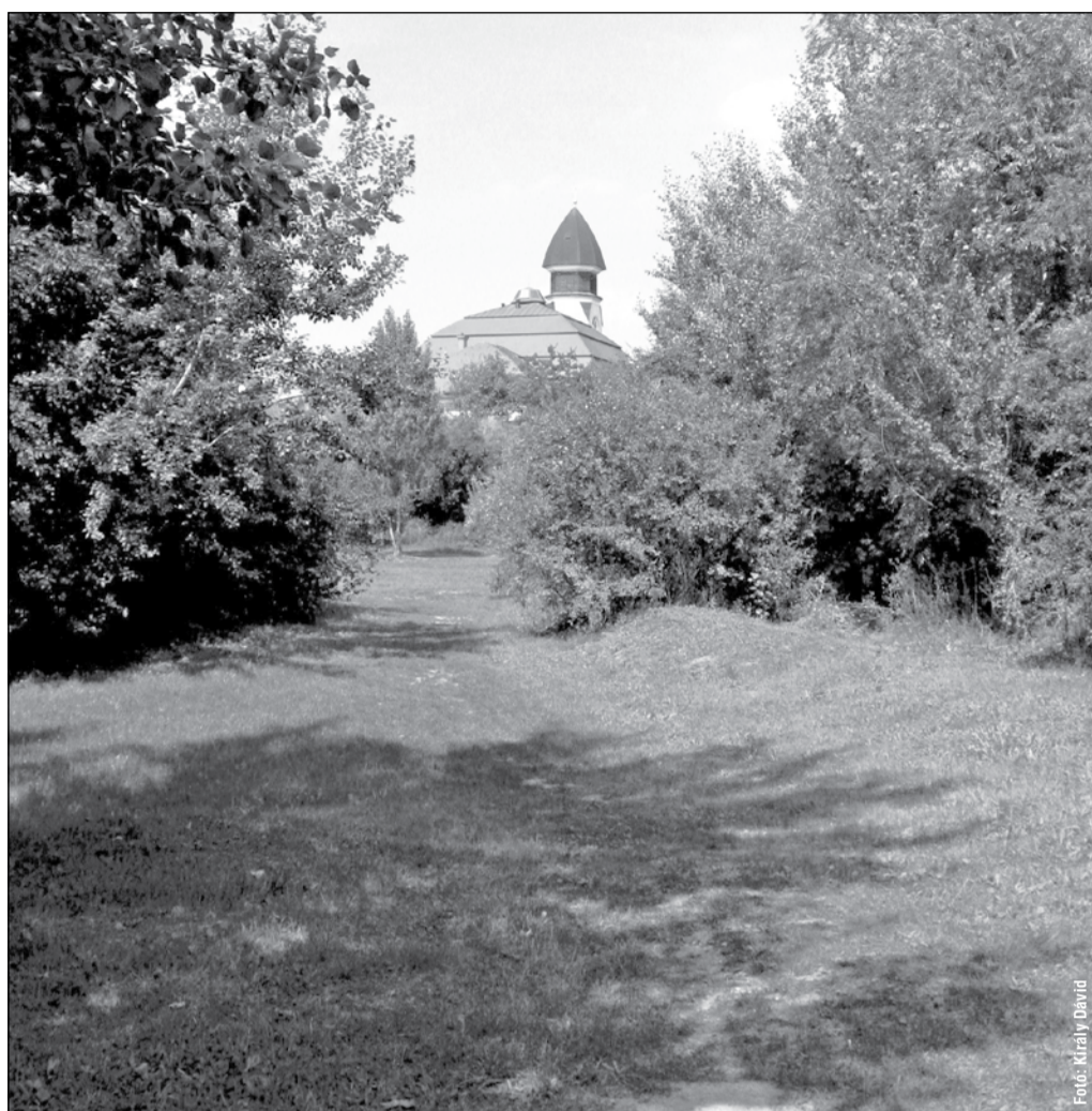
Rácbánya, háttérben a Budai úti református templommal