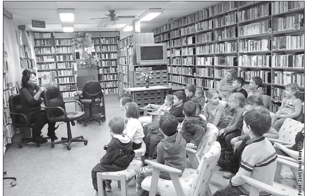
A könyvvel való ismerkedést nem lehet elég korán kezdeni – könyvtári óra kicsiknek és nagyobbaknak