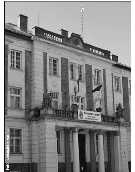
Az Óbudai Egyetem Alba Regia Műszaki Kara első eredményei mindenképpen pozitívak

Székesfehérváron működik az Óbudai Egyetem Alba Regia Műszaki Kara, mely az Óbudai Egyetem korábbi Alba Regia Egyetemi Központjának és a Nyugat-magyarországi Egyetem korábbi Geoinformatikai Karának összeolvadásával jött létre. Itt villamosmérnöki, informatikai, mechatronikai, műszaki-gazdasági, illetve földmérési, térképészeti, geoinformatikai képzés zajlik. Székesfehérvárnak azonban gazdasági, pénzügyi, gazdaságinformatikai és HR-es szakemberekre lenne szüksége. Ezért azt is tervezik, hogy a Corvinus Egyetem itt indítana kihelyezett gazdasági, pénzügyi, valamint személyügyi, humánpolitikai képzést. Az elképzelések szerint ez a helyi cégek bevonásával akár duális képzésként is indulhatna, melynek során a hallgatók már tanulmányaik alatt egy-egy helyi vállalkozásnál szerezhetnének gyakorlatot.