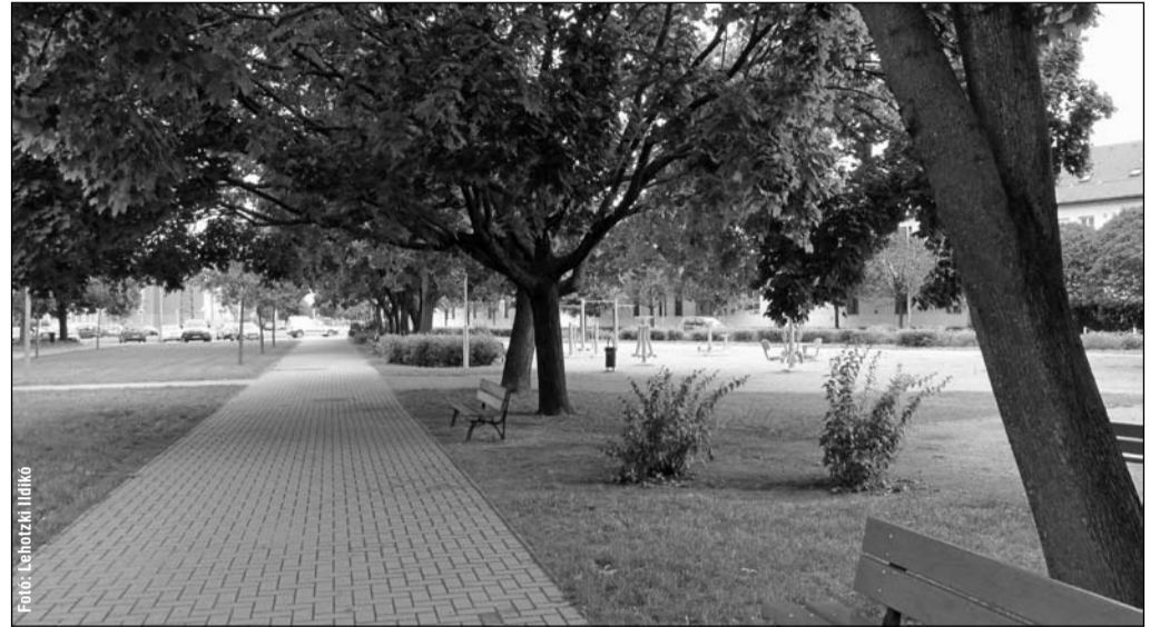
Az elmúlt évek alatt megújult a Széna tér is

Az előző évben a Saára Gyula program forrásai- ból közel ötven millió forintot tudott felhasználni a körzet. Megvalósult a Nefelejcs utca aszfaltozá-