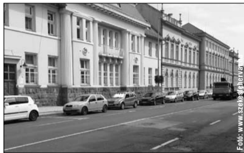
A Dózsa György úton már könnyebb a parkolás

A Liget sor útburkolatának teljes felújítása már az előző évben is szerepelt a legfontosabb tervek között. A pályázati folyamat elhúzódása miatt ez átkerült a 2016-os évre, de idén mindenképpen el is kezdődik, és a város szándéka szerint legkésőbb a jövő év elejére be is fejeződik. Ugyancsak