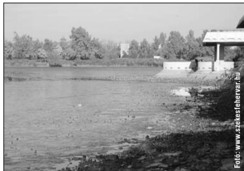
A Csónakázó-tó – még felújítás előtt

A III. Béla király tér és környéke forgalmi rendjének változtatása tavaly nyár végén megtörtént, és határozottan enyhített a korábbi gondokon. Teljes mértékben természetesen nem sikerült megoldani a parkolási és közlekedési problémákat, de a korábbinál lényegesen könnyebb parkolóhelyet találni – ami különösen a környéken